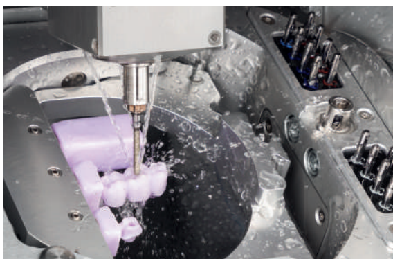
Opción de pulido en húmedo