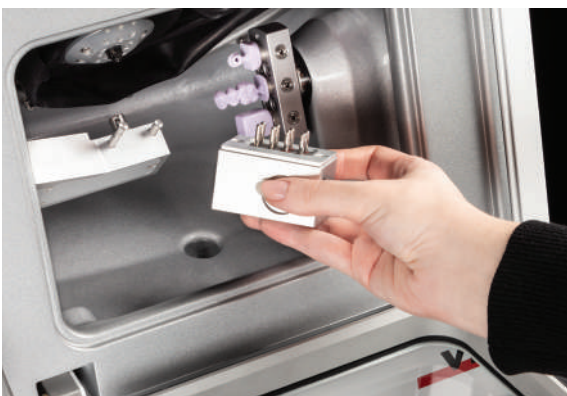
Colocación del cambiador de fresas con una sola mano