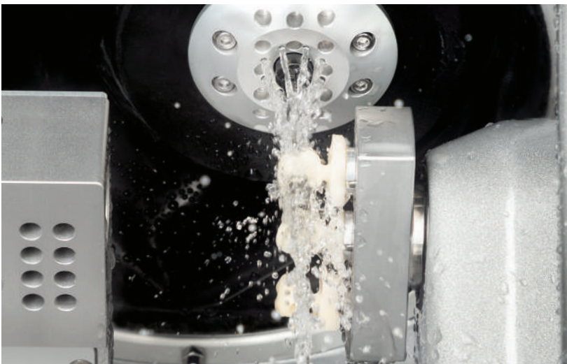
Pulido de alta precisión de vitrocerámica y composites